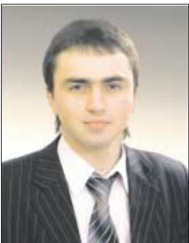
Уважаемые жители района!

За отчетный период мной, как депутатом муниципального Собрания (работа ведется на общественных началах), осуществлялась деятельность по следующим направлениям: участие и работа в заседаниях и комиссиях муниципального Собрания; участие в мероприятиях, проводимых муниципалитетом и управой района; прием жителей; работа по наказам избирателей; работа с общественными и молодежными организациями; работа с учебными заведениями; оказание адресной помощи малообеспеченным категориям жителей.