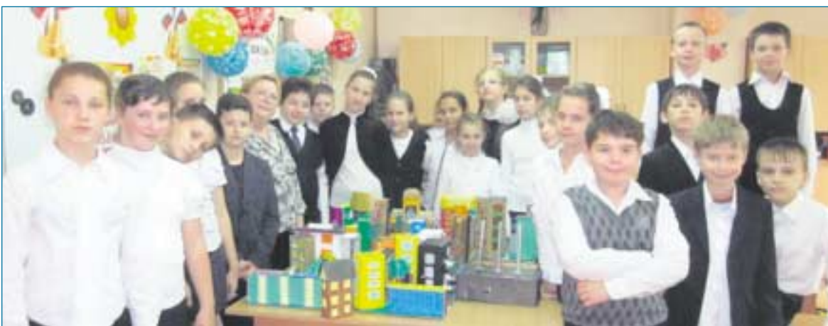
4 «Б» класс – проектирование по теме «Улицы города».