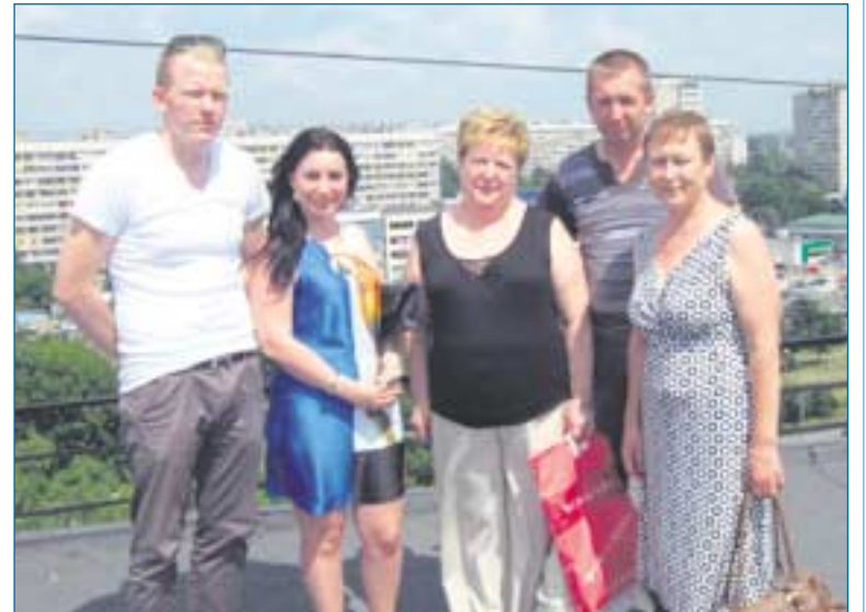
Комиссия принимает работы по ремонту кровли дома 98 корпус 1 по шоссе Энтузиастов.

– 8 сентября 2013 года состоятся выборы мэра – председателя Правительства Москвы, и я как депутат Совета депутатов муниципального округа Ивановское собираюсь принять в них участие. В этот день нам предстоит не только из-